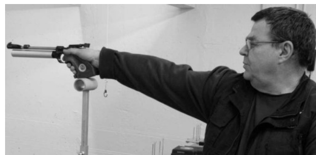
PHOTO N° 2 : position au pistolet